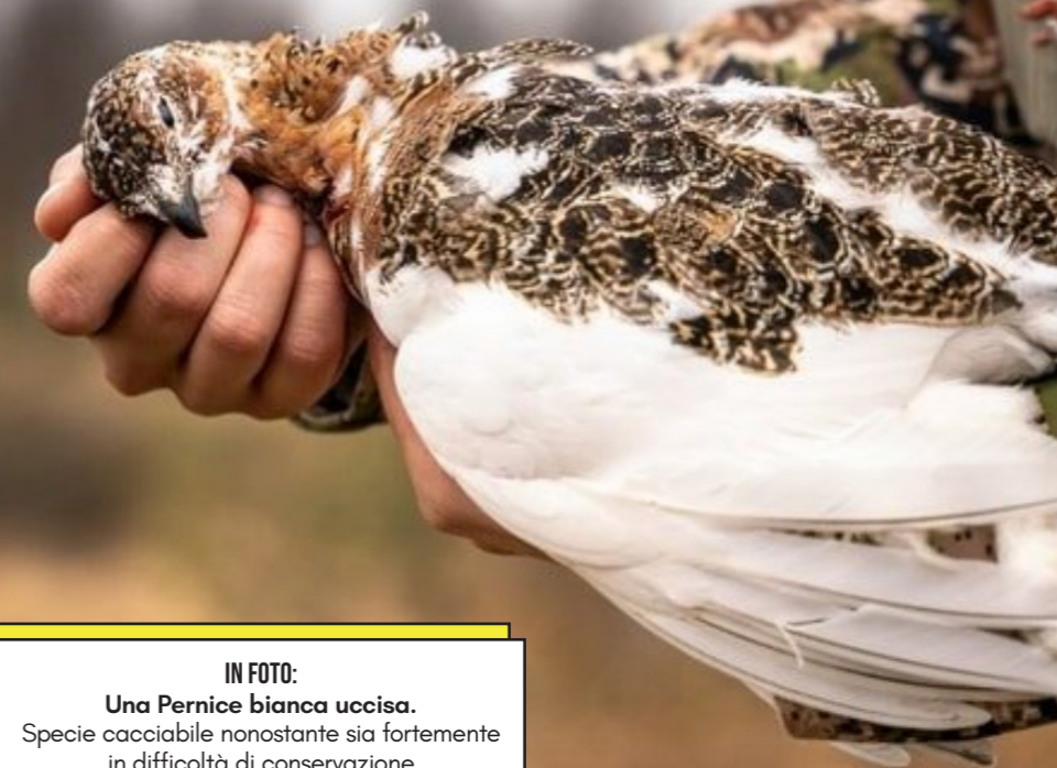
IN FOTO: Una Pernice bianca uccisa. Specie cacciabile nonostante sia fortemente in difficoltà di conservazione

Minacciati dalla caccia anche alcuni tetraonidi quali il Gallo forcello e soprattutto la rarefatta Pernice bianca,