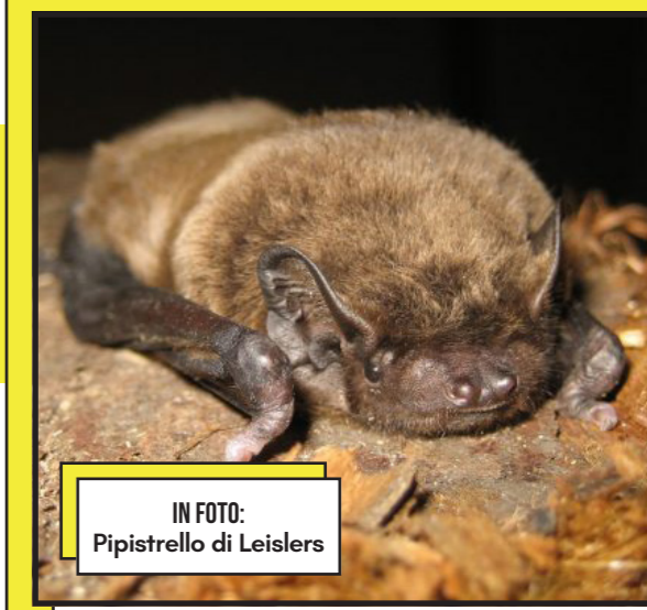
IN FOTO: Pipistrello di Leislers

A spingere i ricercatori ad approfondire è stato un preciso sospetto: qualcosa stava appunto cambiando nel comportamento dei pipistrelli di Leisler, una specie tipicamente forestale, osservata sempre più spesso in contesti abitativi. Così, un team di scienziati del Leibniz Institute for Zoo and Wildlife Research ha condotto accurate indagini mai svolte finora su questa specie.