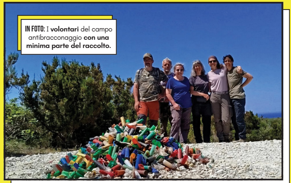
IN FOTO: I volontari del campo antibracconaggio con una minima parte del raccolto.

Tutto si è semplicemente fermato con il loro arrivo, segnalato già al momento del pur discreto sbarco nel porto , perché i bracconieri di Ponza possono contare su connivenze e sentinelle efficienti , e proprio il loro arrivo ha sicuramente contribuito a far ripartire indenni verso la Penisola e il Nord moltissimi uccelli - dai gruccioni ai lui, dai rigogoli alle tortore - lasciando l'amaro in bocca e provocando le lamentele e gli insulti di chi sperava di saccheggiarli.