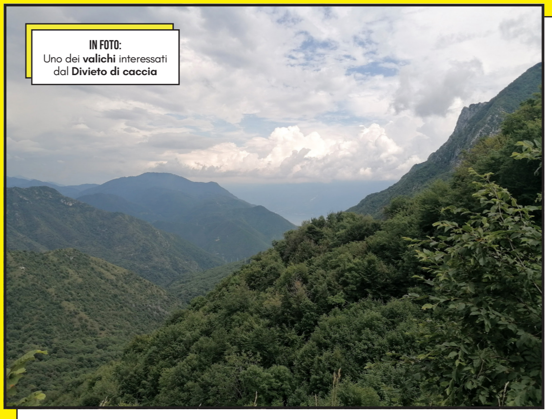
IN FOTO: Uno dei valichi interessati dal Divieto di caccia

Respingendo le istanze della Regione Lombardia, delle sigle degli sparattutto - dall'Annu alla Federcaccia - e pure le valutazioni in retromarcia dell'Istituto superiore per la ricerca e la protezione ambientale, la camera di consiglio del TAR Lombardia ha, in sintesi, di fatto ribadito che, oltre agli studi di settore e centri di inanellamento a scopo scientifico esistenti da decenni, la caccia debba essere vietata nel raggio di mille metri in tutti i 475 valichi individuati (da molto tempo) nella nostra Regione.