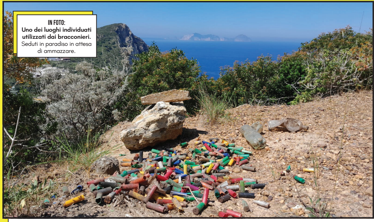
IN FOTO: Uno dei luoghi individuati utilizzati dai bracconieri. Seduti in paradiso in attesa di ammazzare.

perlustrando orti e macchie hanno scoperto una serie di « schiacce » in attività, orribili trappole a caduta che straziano gli uccelli, mini tagliole da uccellazione nuove di zecca, a dimostrazione del fatto che il bracconaggio primaverile prosegue, e tappeti di bossoli abbandonati nelle postazioni di tiro illegali dalle quali si spara a qualsiasi cosa.