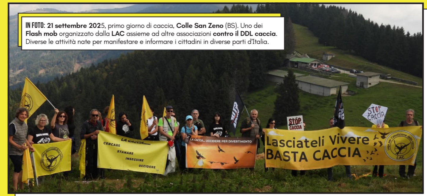
IN FOTO: 21 settembre 2025, primo giorno di caccia, Colle San Zeno (BS). Uno dei Flash mob organizzato dalla LAC assieme ad altre associazioni contro il DDL caccia. Diverse le attività nate per manifestare e informare i cittadini in diverse parti d'Italia.