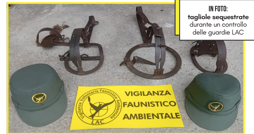
IN FOTO: tagliole sequestrate durante un controllo delle guardie LAC

E' il secondo caso di rinvenimento di trappole per animali in vendita al mercatino dell'usato di Pinerolo, nei mesi scorsi le guardie venatorie della LAC avevano rinvenuto infatti alcune tagliole in vendita.