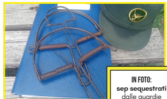
IN FOTO: sep sequestrati dalle guardie

Le Guardie LAC assicurano la vigilanza sul rispetto delle norme a tutela di animali e ambiente tutto l'anno, come recentemente accaduto dopo controlli in mercatini a Pinerolo (TO), dove hanno scoperto e sequestrato trappole atte alla cattura di animali.