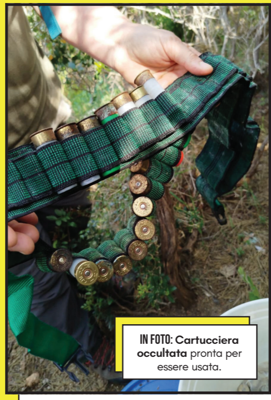
IN FOTO: Cartucciera occultata pronta per essere usata.

Non hanno trovato reti da uccellazione in attività, ma individuato numerose preparazioni pronte ad accoglierle se non ci fossero stati loro a impedirne l'uso. In compenso