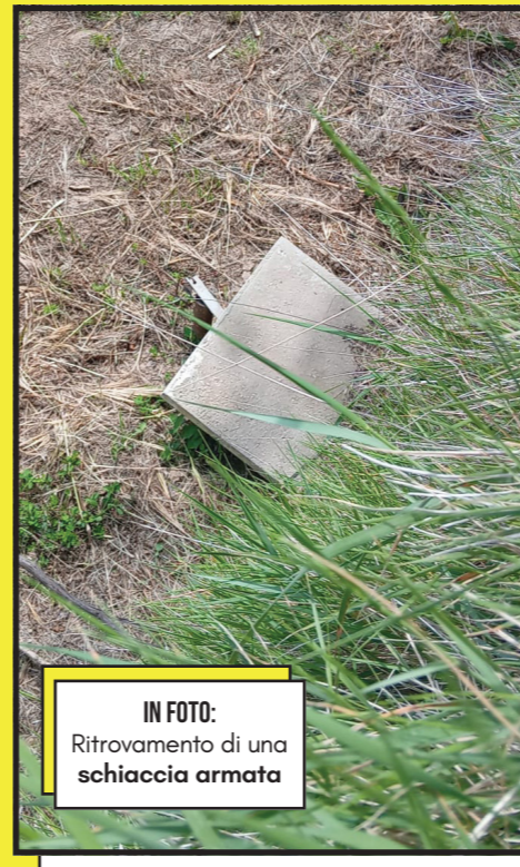
IN FOTO: Ritrovamento di una schiaccia armata

perlustrando orti e macchie hanno scoperto una serie di « schiacce » in attività, orribili trappole a caduta che straziano gli uccelli, mini tagliole da uccellazione nuove di zecca, a dimostrazione del fatto che il bracconaggio primaverile prosegue, e tappeti di bossoli abbandonati nelle postazioni di tiro illegali dalle quali si spara a qualsiasi cosa.