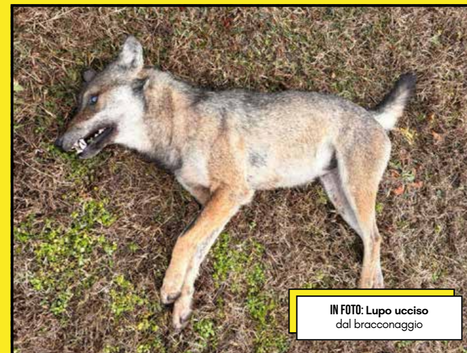
IN FOTO: Lupo ucciso dal bracconaggio

► Secondo le stime più aggiornate, in Piemonte la popolazione attuale di lupi si attesta attorno ai 464 esemplari.