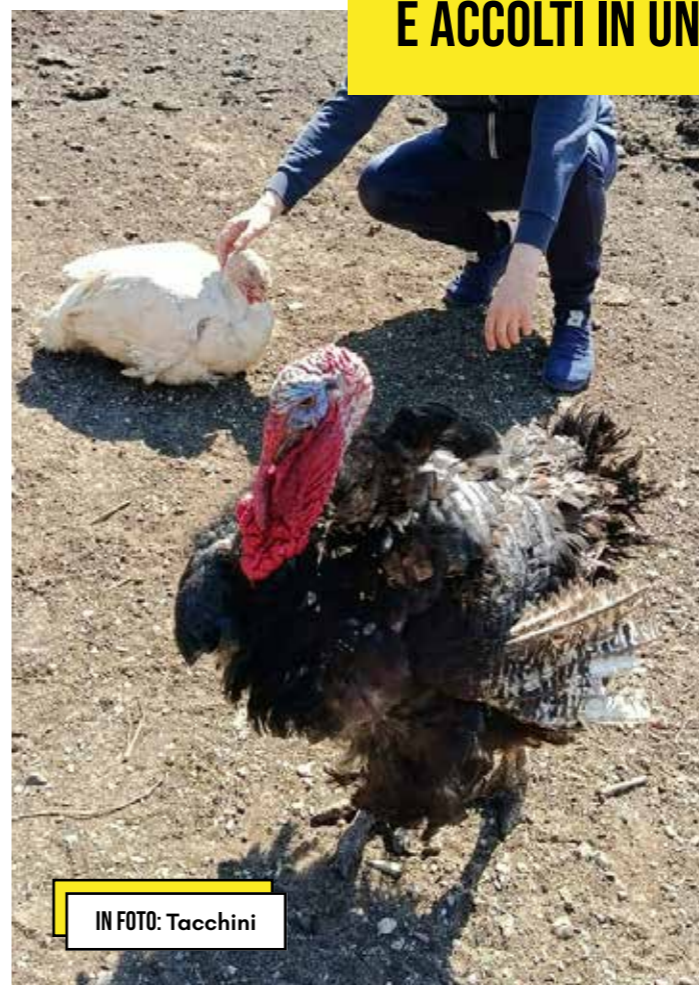
IN FOTO: Tacchini

▶ ALCUNI DEGLI ANIMALI SALVATI E ACCOLTI IN UNA DELLE OASI LAC