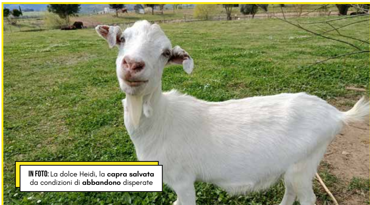
IN FOTO: La dolce Heidi, la capra salvata da condizioni di abbandono disperate