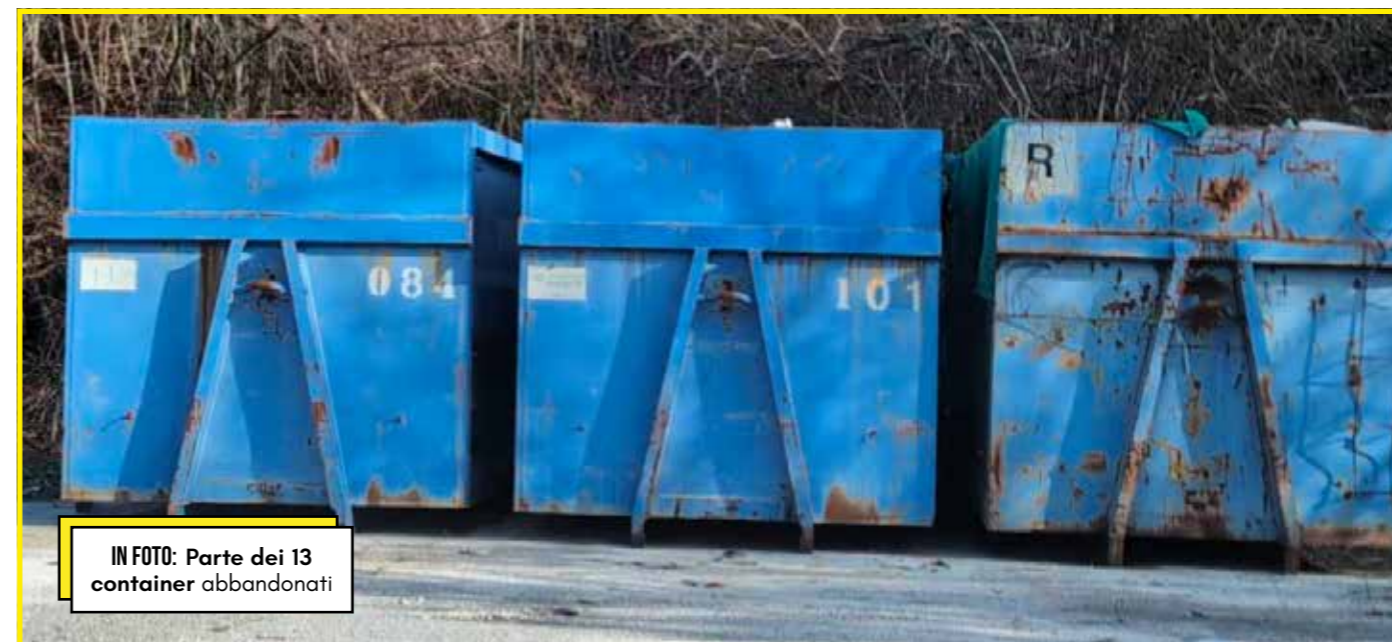
IN FOTO: Parte dei 13 container abbandonati

La "tensione elettrica" percepita dagli esperti sul campo, suggerisce che la portata reale del fenomeno sia ben più profonda e che il confine tra ciò che era ritenuto lecito e l'illegalità manifesta, stia per essere cancellato definitivamente .