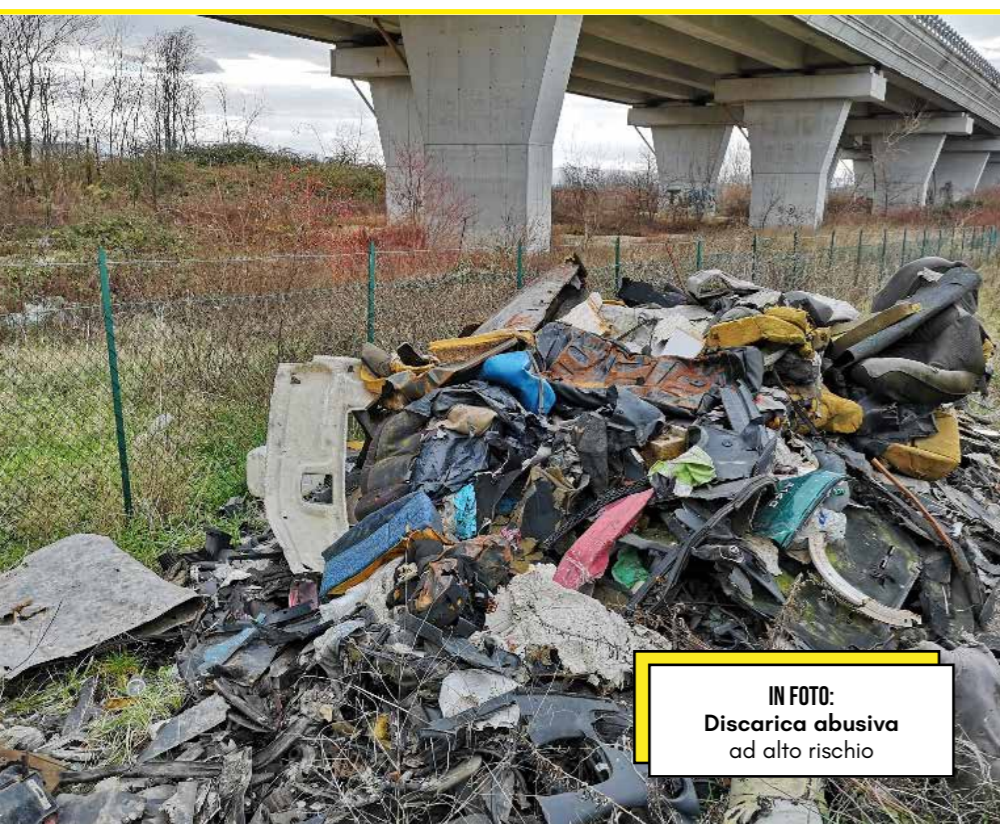
IN FOTO: Discarica abusiva ad alto rischio

Droni, visori termici e rigore giuridico: i volontari dell'Associazione LAC setacciano palmo a palmo l'Appennino. Sotto la lente non solo discariche abusive , ma un sistema di illegalità che per anni è rimasto invisibile pur essendo alla luce del sole. «Siamo pronti a svelare l'impensabile».