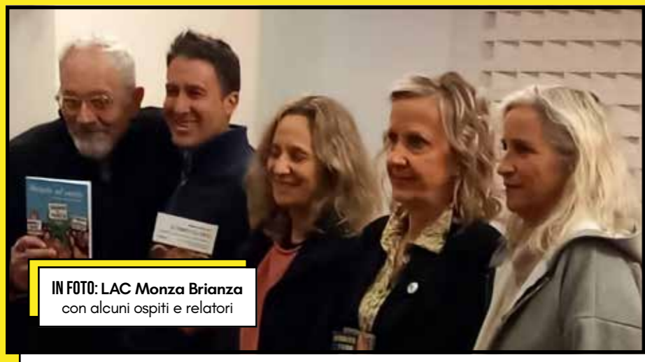
IN FOTO: LAC Monza Brianza con alcuni ospiti e relatori

La risposta della cittadinanza è stata estremamente positiva: partecipazione, interesse e coinvolgimento hanno confermato quanto sia forte il bisogno di informazione e confronto sui temi ambientali.