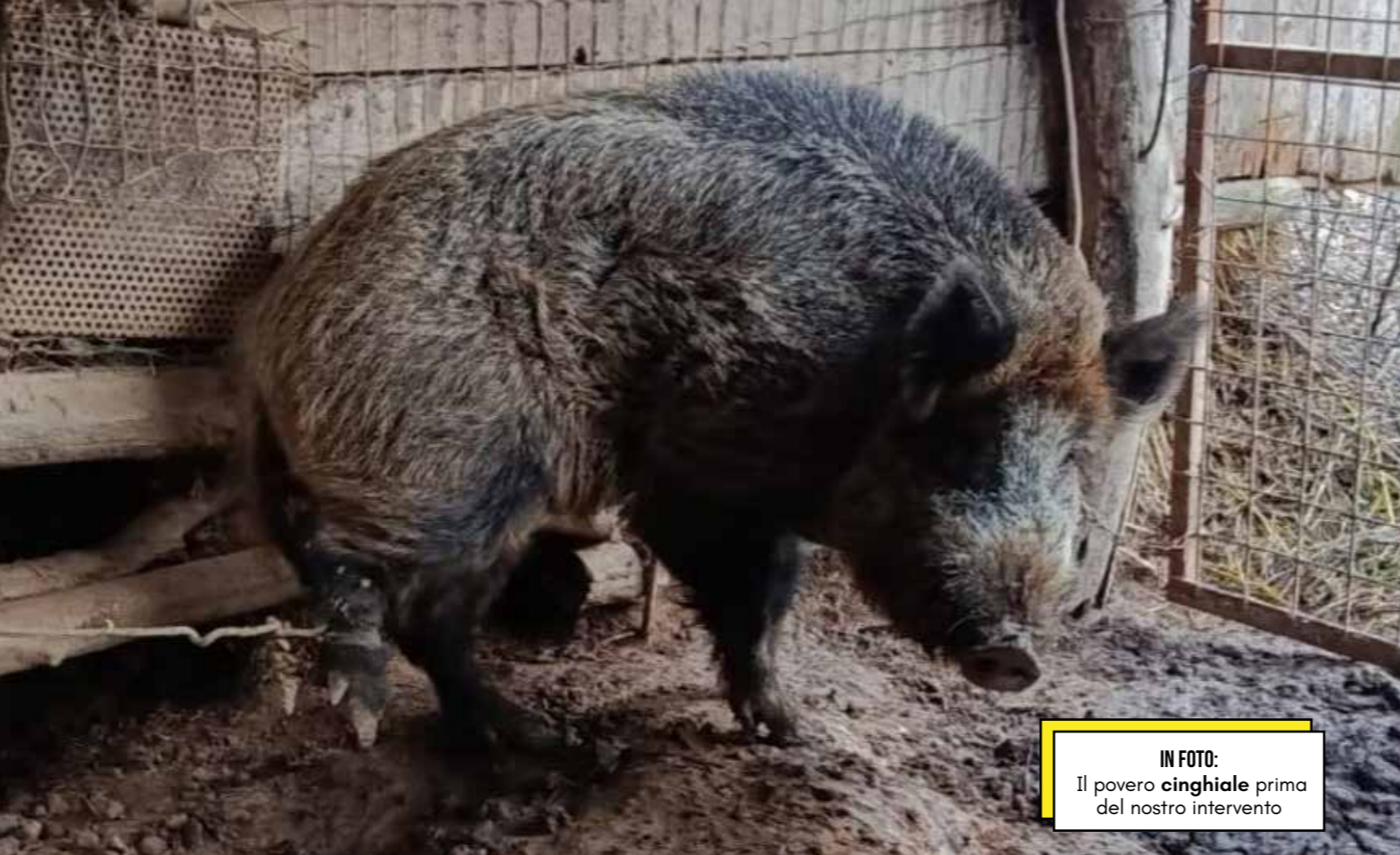
IN FOTO: Il povero cinghiale prima del nostro intervento

Secondo quanto emerso, il cinghiale sarebbe rimasto in quelle condizioni per anni . Solo dopo diversi giorni di cure i volontari della LAC sono riusciti ad avvicinarsi e tagliare lentamente la corda che lo tratteneva. L'operazione è durata circa una settimana .