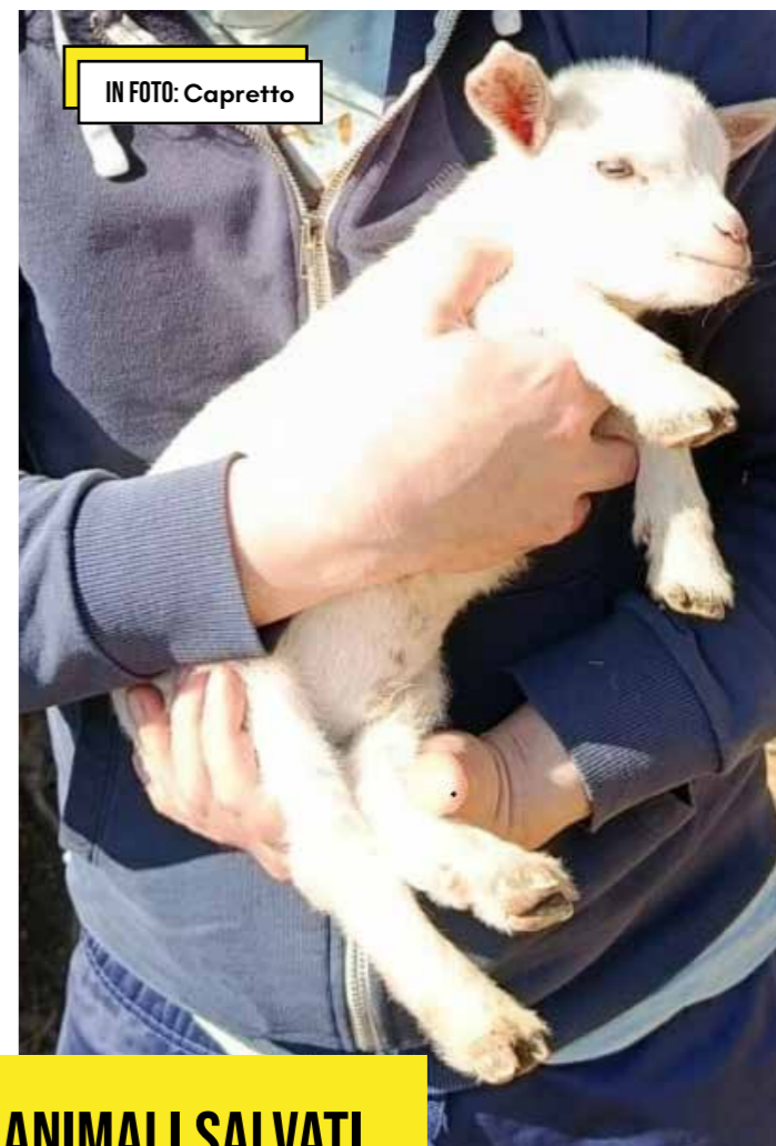
IN FOTO: Capretto

▶ ALCUNI DEGLI ANIMALI SALVATI E ACCOLTI IN UNA DELLE OASI LAC