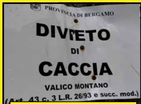
IN FOTO: Cartello in un valico montano, dove per legge dopo le numerose vittorie a TAR e Consiglio di Stato (prima dell'intervento del governo Meloni) era vietato alla caccia

Dopo che regione Lombardia aveva perso ai numerosi ricorsi, tutti targati LAC, per ottenere il divieto di caccia su ben 475 valichi e nel loro raggio fino a 1000 metri, il governo Meloni è corso in aiuto della lobby venatoria in Lombardia modificando la legge nazionale che disponeva tale divieto. Regione Lombardia ha così nuovamente modificato la normativa regionale sulla caccia in favore dell'attività venatoria sui valichi montani interessati dalle rotte di migrazione.