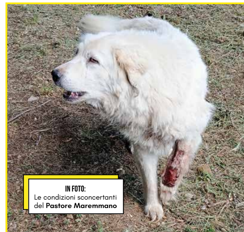
IN FOTO: Le condizioni sconcertanti del Pastore Maremmano

Di certo non resterà in canile, siamo disposti, alla fine dell'iter giudiziario, ad adottare il cane, come la maggior parte dei cani sequestrati dalla nostra Associazione. ■