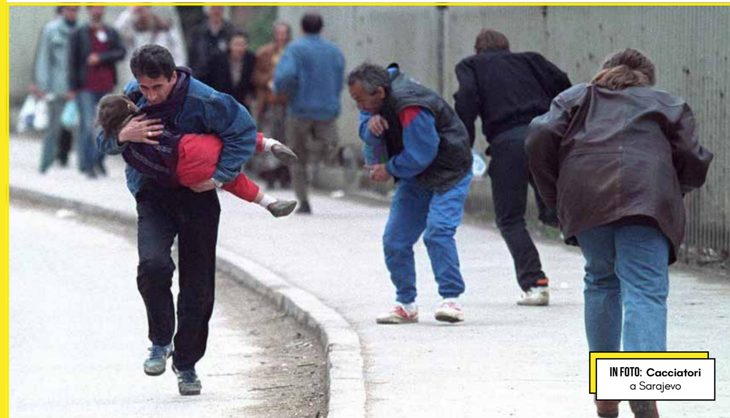
IN FOTO: Cacciatori a Sarajevo