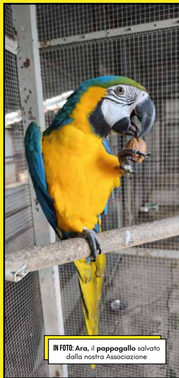
IN FOTO: Ara, il pappagallo salvato dalla nostra Associazione

Nonostante i palesi maltrattamenti che ha subito, il Pubblico Ministero ha archiviato la nostra denuncia "perchè non ravvisa tali reati", ma la LAC ha presentato opposizione all'archiviazione che è stata ovviamente accolta: il giorno 11 maggio ci sarà l'udienza innanzi al Giudice del Tribunale di Grosseto. Seguiremo per la capretta l'iter giudiziario e chiederemo giustizia. ■