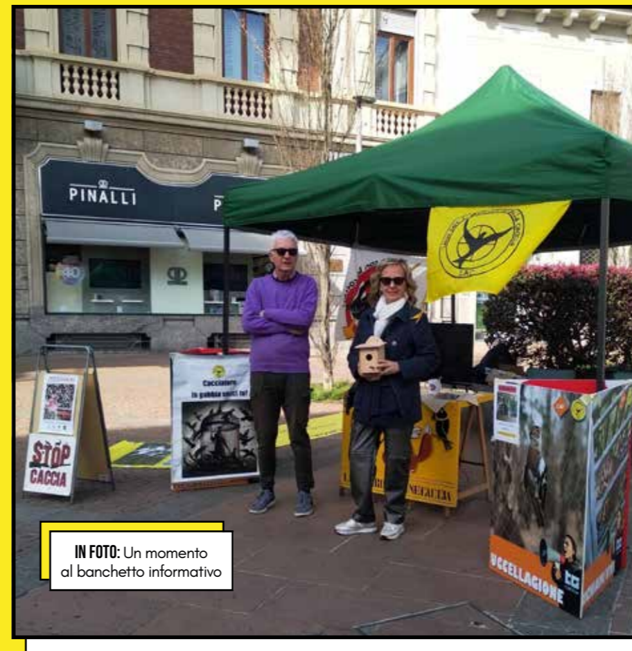
IN FOTO: Un momento al banchetto informativo