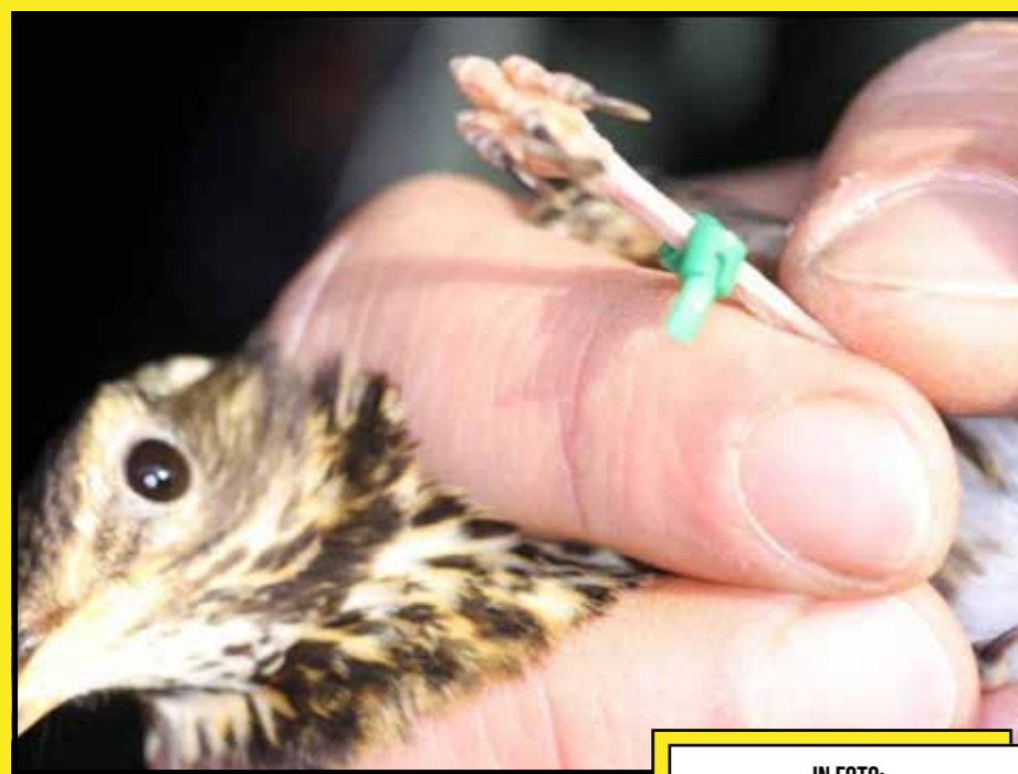
IN FOTO: RICHIAMO vivo con fascetta

È, di fatto, una legalizzazione del bracconaggio su scala regionale, basata su autocertificazioni prive di qualsiasi rigore scientifico. Un castello di carte che la LAC ha deciso di abbattere, impugnando la sanatoria davanti al TAR per palese contrasto con le norme nazionali ed europee.