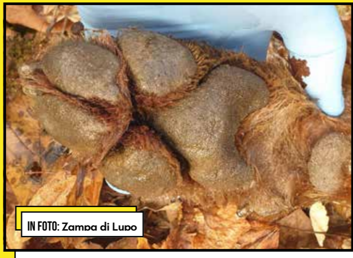
IN FOTO: Zampa di Lupo

Parallelamente, è indispensabile promuovere una comunicazione rigorosa e basata su dati verificabili , in grado di contrastare la disinformazione e di ricondurre il confronto su basi scientifiche e responsabilità condivise.