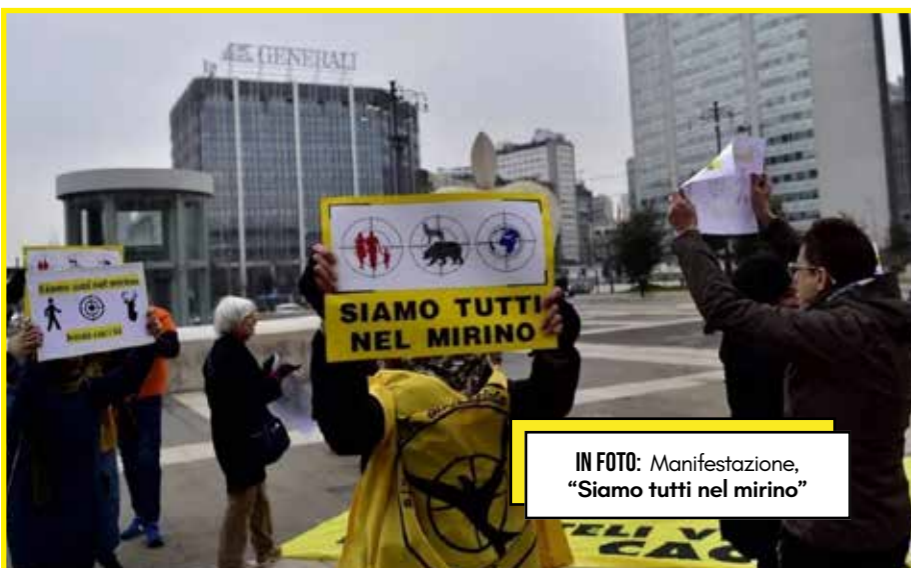
IN FOTO: Manifestazione, "Siamo tutti nel mirino"