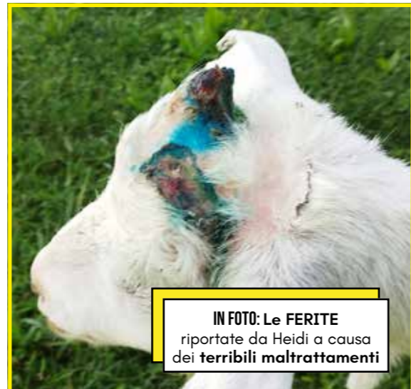
IN FOTO: Le FERITE riportate da Heidi a causa dei terribili maltrattamenti

La LAC per i soprusi che ha subito Heidi ha presentato denuncia contro ignoti, per il reato di lesioni gravissime (art. 544 ter) e per il reato di abbandono di animali (Art. 727 c.2).