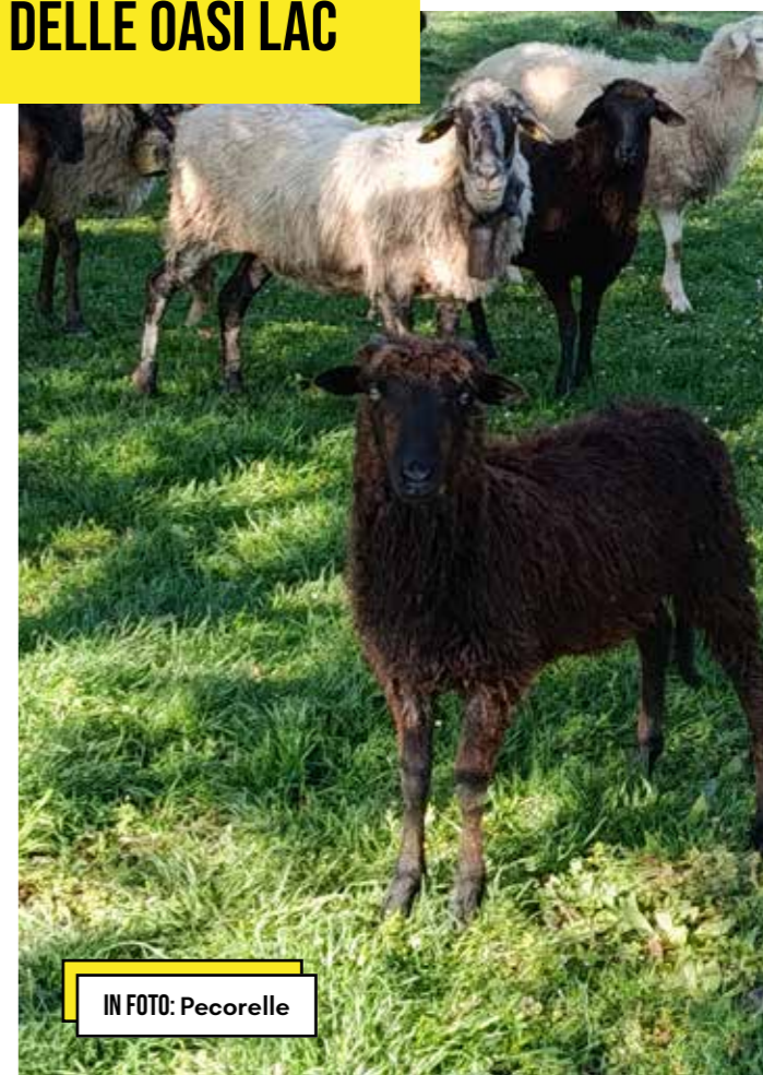
IN FOTO: Pecorelle