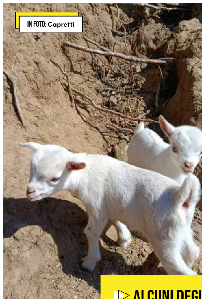
IN FOTO: Capretti