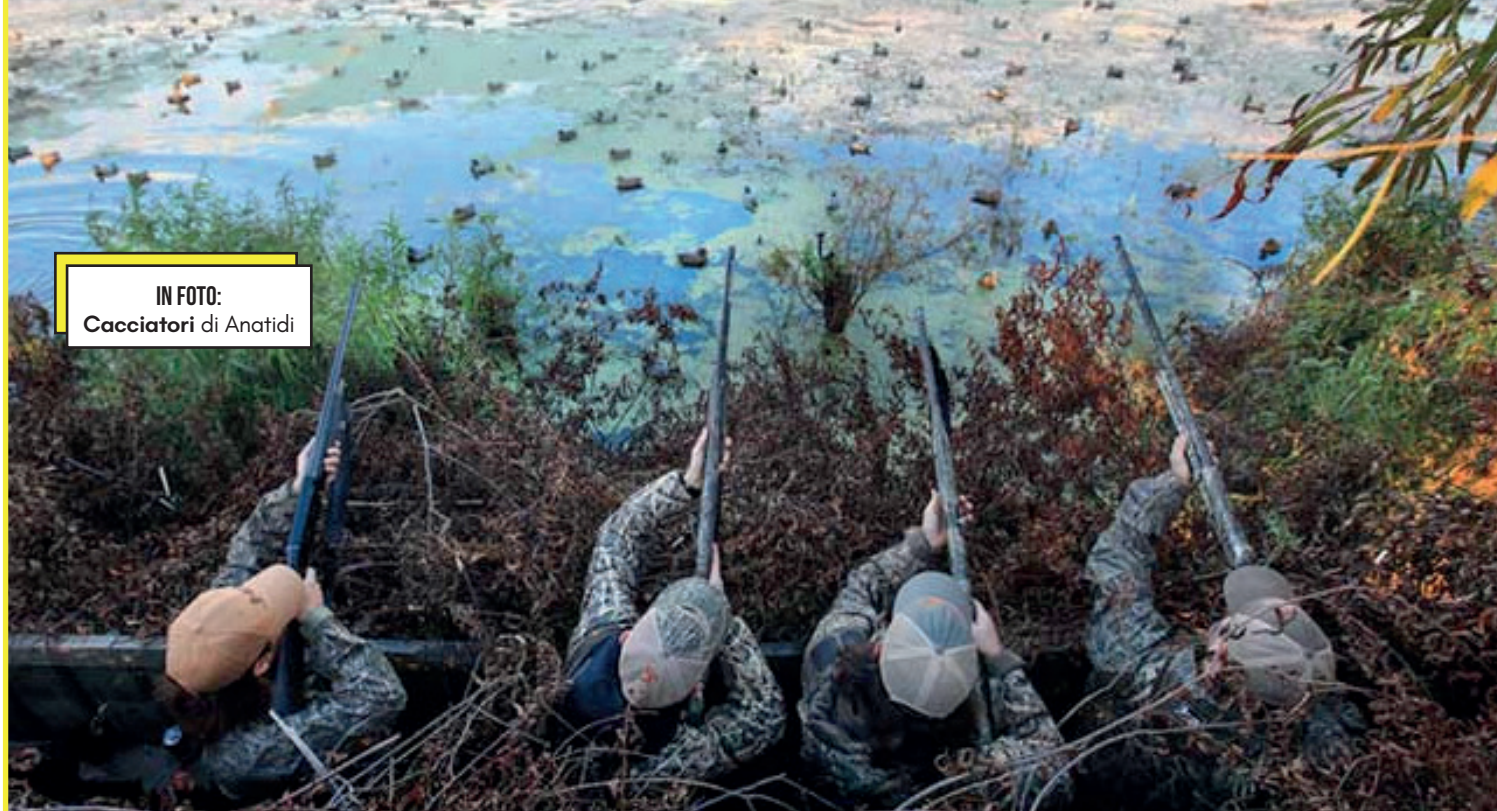
IN FOTO: Cacciatori di Anatidi