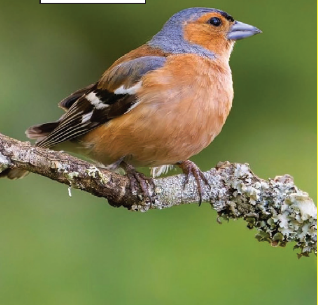
IN FOTO: Un FRINGUELLO maschio

Fringuelli e Storni sono specie non cacciabili in Italia in base alle vigenti disposizioni venatorie nazionali ed europee.