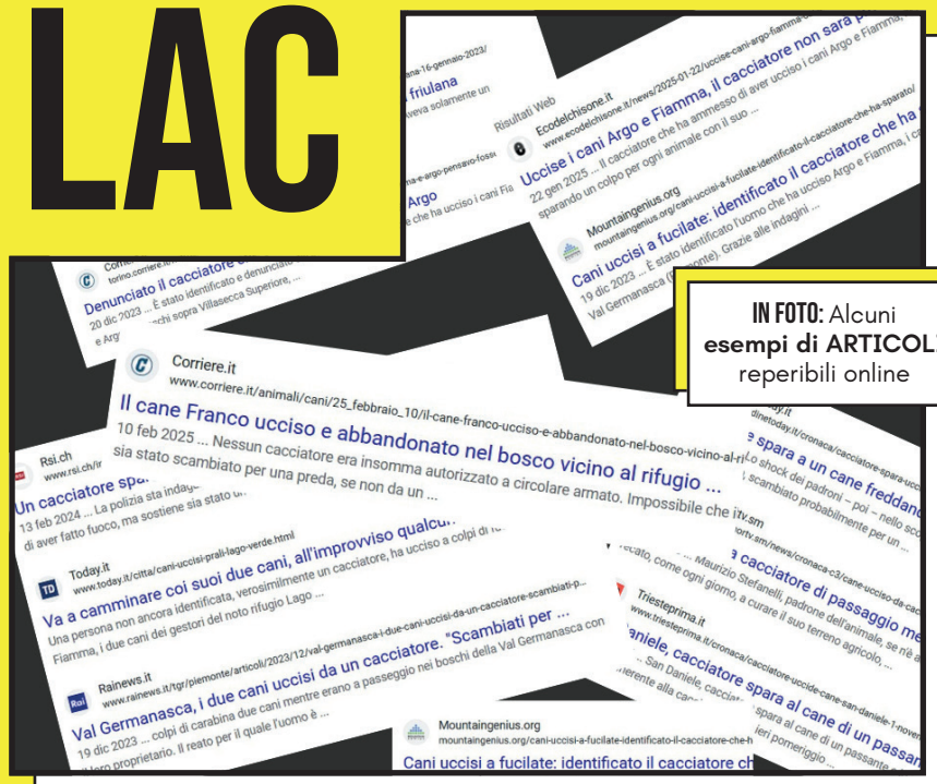
IN FOTO: Alcuni esempi di ARTICOLI reperibili online