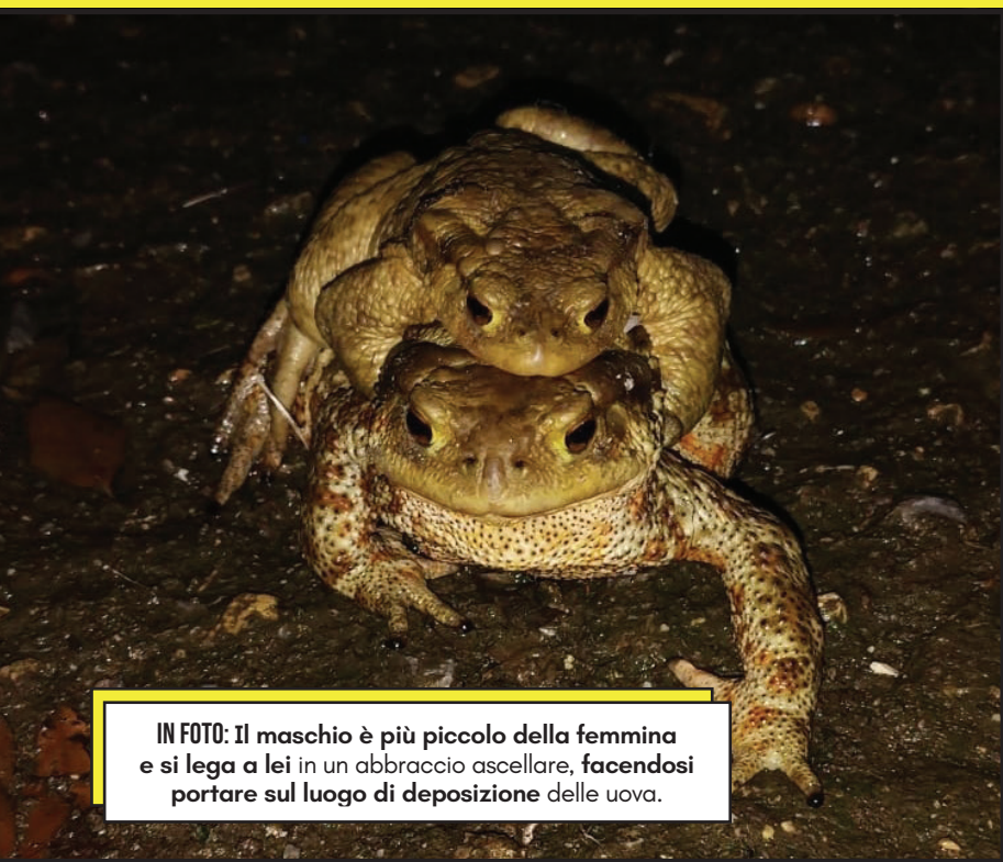
IN FOTO: Il maschio è più piccolo della femmina e si lega a lei in un abbraccio ascellare, facendosi portare sul luogo di deposizione delle uova.

A causa della presenza di questa specie aliena si è creato un effetto moltiplicatorio di altre specie come l'airone cenerino, che, grazie all'aumento di gamberi, aumenta a sua volta, cibandosi di essi e nel contempo anche di altri animali come pesci e rospi. L'aumento dei predatori crea quindi un disequilibrio che ha un impatto negativo sull'ambiente.