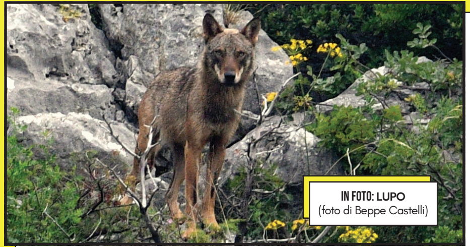
IN FOTO: LUPO

La Commissione europea dovrà quindi avanzare una proposta in tal senso e trovare il consenso di tutti e 27 i Paesi dell’Unione.