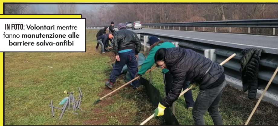
IN FOTO: Volontari mentre fanno manutenzione alle barriere salva-anfibi

Oltre ai problemi legati al cambiamento climatico, il traffico è un altro pericolo imminente per questi anfibi. Il periodo nel quale si trovano più a rischio è durante la migrazione primaverile riproduttiva, che solitamente va da metà marzo a fine aprile, ovvero quando si spostano dai boschi per raggiungere l'acqua dove depongono le uova. Nel fare ciò, attraversano le strade e vengono schiacciati dai veicoli in transito.