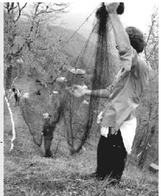
Volontari smantellano rete da uccellazione

La decima campagna anti-bracconaggio nel Cagliariitano si è svolta nelle zone a maggior attività di caccia illegale del sud Sardegna fra il 28 ottobre ed il 4 novembre 2006. Sono state effettuate 12 battute per la ricerca di trappole (in contatto con le locali Stazioni del CF e di Vigilanza Ambientale), perlustrando le località di Sette Fratelli (Sinnai - Maracalagonis), S. Barbara, Punta Sa Menta, Monte Pauliara, S. Girolamo (Capoterra), Santa Lucia, Gutturu Mannu (Assemmini - Santadi), Monte Arcosu (Uta). Complessivamente hanno preso parte alle operazioni una quindicina di volontari provenienti da varie regioni italiane. Sono state rinvenute 60 reti per l'uccellazione, 12.000 lacci per avifauna (tordi, pettirossi, frosoni, verdoni, ecc.), 25 cavi metallici per ungulati, 7 trappole a scatto metalliche delle quali una grande per ungulati. Nel corso delle operazioni sono stati rinvenuti 98 "altri animali" (pettirossi, tordi, fringuelli, merli, ecc.) morti, mentre 16 sono stati rinvenuti vivi (pettirossi, fringuelli e tordi) e sono stati liberati.